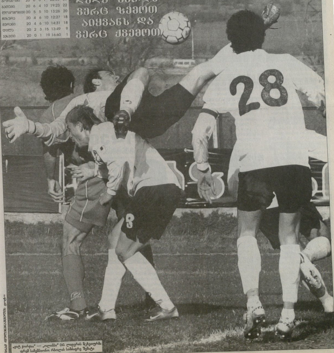
„ვიტ ჭორჯია“ — „ოლიმპი“ იმ. ლიდერის მცხეთურმა ფრემ საბეგბილი რბოლის სიმბოლო შემატა