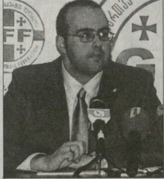
საქართველოს ფეხბურთის ფედერაციის პრეზიდენტი ნოდარ ახალაგაძე

ნოდარ ახალაგაძე და გერმანულმა მდინარე ურა უგულავმა გუნდს პრესკონფერენციაზე განუცხადეს, სადაც შეეცადნენ ნიონში ვიზიტზე ისაუბრეს. 28 მაისს ციურხონი უფასო რიგგარეშე კონკრეტული გამართება და სწორედ წინასწორგეგმი მონაწილეები საქმიანობის განხილვას დაესწრნენ ახალაგაძე და უგულავა. ნოდარ ახალაგაძე ნიონში რვა ქვეყნის ფედერაციების ხელმძღვანელები იყვნენ, 28 მაისამდე კი სხვა ქვეყნის ფედერაციებზე ჩაუდგინა უფასო ხელმძღვანელების გარდა, სხვა ქვეყნების ფედერაციათა წარმომადგენლებსაც შეუხვდა. ნიონში უფასო პრეზიდენტი ნოდარ ახალაგაძე და გერმანულმა მდინარე ურა უგულავმა გუნდს პრესკონფერენციაზე განუცხადეს, სადაც შეეცადნენ ნიონში ვიზიტზე ისაუბრეს. 28 მაისს ციურხონი უფასო რიგგარეშე კონკრეტული გამართება და სწორედ წინასწორგეგმი მონაწილეები საქმიანობის განხილვას დაესწრნენ ახალაგაძე და უგულავა.