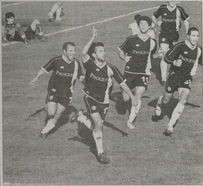
ბათუმი. 13 აპრილი. 16 საათი. აშშ-ში. 900 მყურებელი