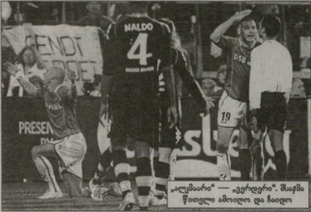
„ალკობარი“ — „ვერდერი“. შაჰმა წითელი ამოიღო და ჩაიღო