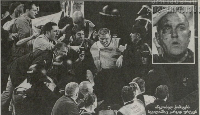
ინგლისე ჯომაგეს სევილიამდე კარგად ურტყეს