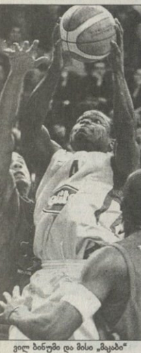
ანბნუნი და მისი „მაჰაბი“ ანბნუნი გერეგეტი

გუბიფიფი გაეხადა ის ორი გუნდი, რომლებსაც ევროლიგის ოთხთა ფინალის სატურნიტი მიიპოვეს. ბასკეთს „ტაუ“ და ბერლინს „პანათინაიკოსმა“ მეთხველიწინაღობა სასპორტიო სერვის მფორე მატჩებიც მიიღეს და 4-6 მასის ათინის ოლიმპიურ დარბაზში კონტინენტის მთავარი საკლუბო ტიტულის მოსაპოვებლად იბრძობებენ.