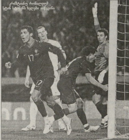
კრიტიკულად რომელიც სტინ სტინგი ხელში დაწვება

ცოტაც და, სტრინგის ისევ დაწვებდნენ — ამჯერად კარგადაც კვლავიერი გადვიტების შემდეგ კრიტიკულად რომელიც თაყური შევალ. ბელგიას გატანის შანსი კი მიუ-