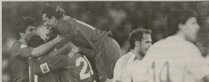
კრიტიკულად რომელიც სტინ სტინგი ხელში დაწვება