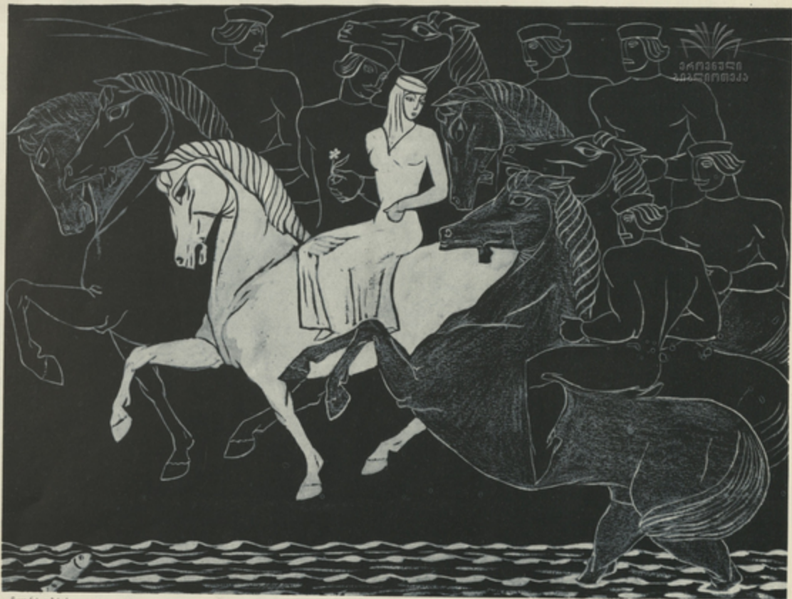
Գրքի տեղ ինչ