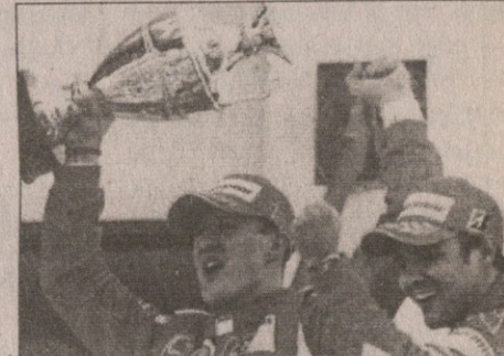
მიხაელ შუმახერმა და ფელიქე მასამ თითქმის დუბლით გაიმარჯვეს

37 წლის მიხაელი ბავშვით გახარებული ჩანდა, ფერნანდო კი, თუმცა რბოლაზე აცხადებდა — ცხრილში იმხელა უპირატესობა მაქვს,