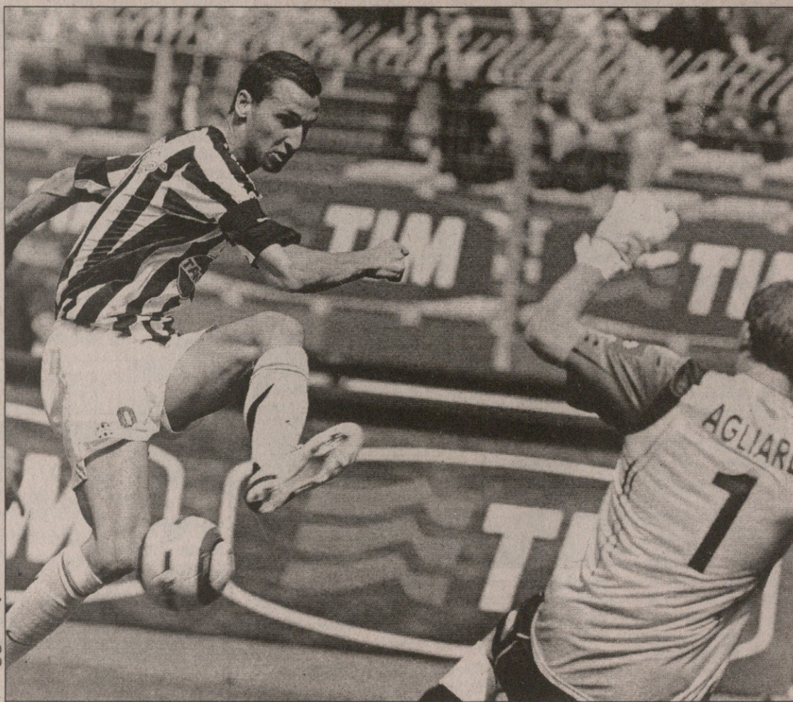
ზლატან იბრაჰიმოვიჩმა ოთხმოცდღიანი ნაგის გატეხა

0:1 სტენდარდო (7), 0:2 ოდო (13), 0:3 პანდევო (20), 1:3 ფრანტი (30), 1:4 როკი (57) ასპოლი: ფ. კოპოლა, ფ. კარონე (პაჩი