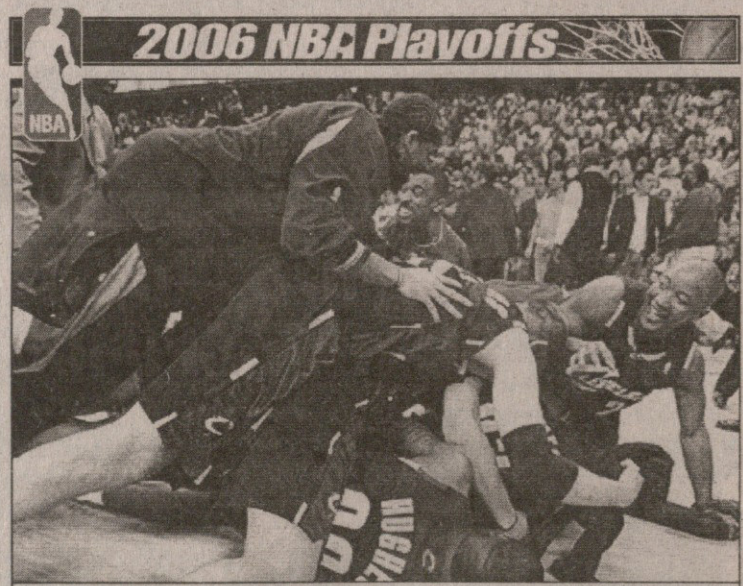
მეორე რაუნდში 13 სეზონში პირველად გასულმა კლივლენდელმა ლამის დააბრუნა „მეინგტონთან“ გადამწყვეტი ბურთის ჩამგდება დევიდონ ჯონსი

5-6 მაისი ალბონსკლავი ჯლივლიანი 4:2 ჰაშიმბონი ვაშინგტონი 113:114 კლივლენდი ძირითადი დრო 107:107 ვაშინგტონი: არენსი (36 ქულა, 11 პასი), დანიელსი (22), ბატლერი (18 ქულა, 20 მოხსნა), ჰეივუდი (17), ჯეიმსონი (15) კლივლენდი: ჯეიმსი (32), მარშალი (28), მიურეი (21)