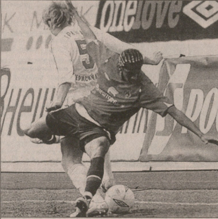
ცსკა-ს ბრაზილიელ ჟოს ჩემპიონატში უკვე ათი გოლი დაუგროვდა

სიხოვმა მეორე მიაბატა. ამის მერე „ზენიტმა“