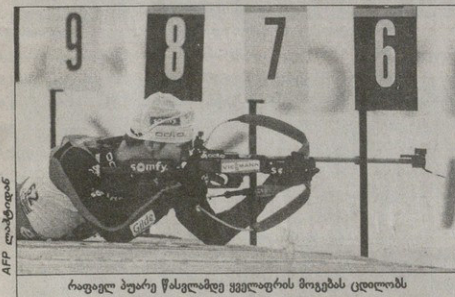
რაფელ პუარე წასაღვად ველოცობს მოგების ცეცხლის

ბასსში სუკურის საბოცინა წლების ბოლოს მიხედვებას ხსენებო, ეს რომ მიდის, ენდა რჩება, აი, დახლებით ანა ბაიტლიონის ფრანგი სუპერგრაისკლასის რაფელ პუარეს საქმე. თორემ ადრევე ჰქონდა ჩივტრუბლი და ნაიტიკა — იტალიურ ანტრესლევაში, მსოფლიოს ჩემპიონატზე წარმატებას თუ მივაღწევ, მორჩა, ეს სხეონი ჩემთვის იტალია. ანტრესლევაში 32 წლის ფრანგმა