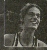
5 მარტი, 2007