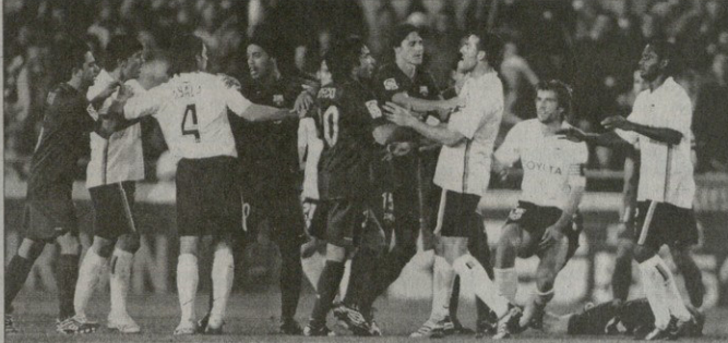
„გაუნესია“ — „პარსელონას“ გაუნეგამოწვაჯე არ დაქლებსა