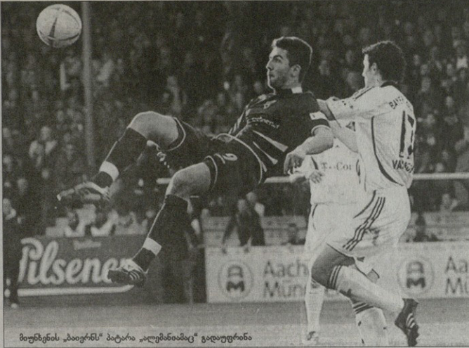
მუხომენის „ბაიერის“ პატარა „პლემბინამ“ ვაღდღურინა

პარამონა XXII ტურნი პარამონა XXII ტურნი პარამონა XXII ტურნი