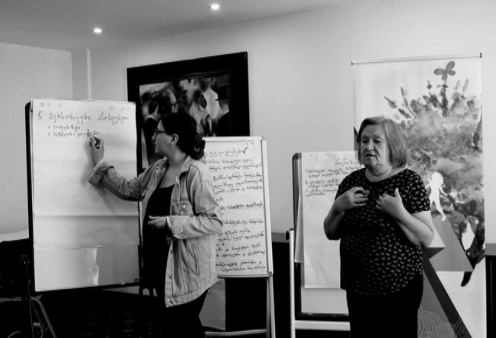
შეზღუდული შესაძლებლობების მქონე პირთა დასაქმების ხელშეწყობის საკითხებზე იმუშავეს.

ხაშურის მუნიციპალიტეტის საკრებულოს თავმჯდომარის ინიციატივით, ხაშურის მუნიციპალიტეტის საკრებულოს 2022 წლის 2 ივნისის №31 განკარგულებით, დროებითი სამუშაო ჯგუფი შეიქმნა, რომელიც