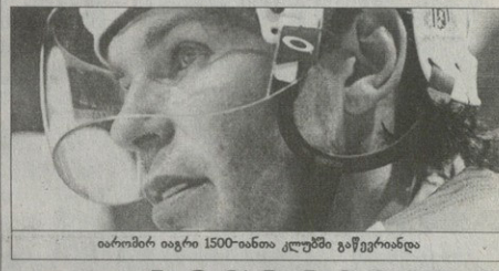
აიროშირა იაგრი 1500-იანთა კლბემა ვაეფრიანდა