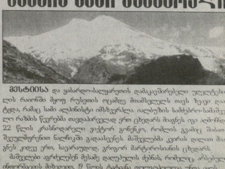
მსტისისა და ვასარო-ალპარეთის დამატებებზე უღლოდ ლეგენდარული რაიონი მყოფ რუსეთის ოცამდე მოამსწილეს თავს ზევი და-ტარა, რაკაც სამი ალპინისტი იმსხვერპლა. იტალიის სამხრეთ-სამხრეთ-ლო რანბის წყვეტმა თვდაარეულად ერთ ცხვარას მათგან იგი აბრ-ბო-22 წლის კასინოდარლო ვიტორი ვინტერი, რომლის ვეპამც შპავის შეულეფრთხი ნაწიკში გადასვლის მამულებმა ევრას დღითი მათ-გნეს კოლე ერთი, საგარეოდ, გროკო მარტროსიასთან ცხვარეს. მამულები აფრტებენ მესამე დღეობის ძებნას, რომელიც არტეული ინფორმაციის მხტევი, 19 წლის ტტანამ აღმოვაპოვდა თავა იყოს.