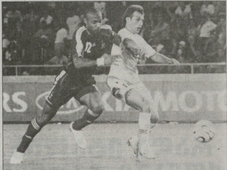
ბაბიხანი „კარლივალს“ ვოლსბო