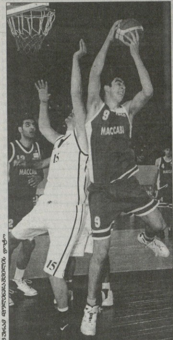
მისათვის მისთვის მოსწონებელი

აზიკაბატასტროფა 18:25 28:27 24:16 34:25 აზიკაბატასტროფა: დ. ბერიძე (16), ხომჯანია (15), ვედილა, ზამბაი... (33), როდუტა (1); ნიკოლოზი (14), ნინიაშვილი (15), სუბოშვილი (1), ზარმაზაძე (6)