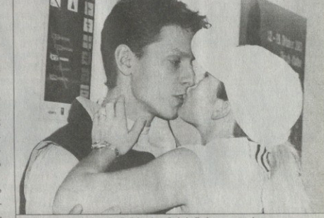
ენინის ენის არღებობის წერტილი დაეჭვა

დაბაძე ორმაზის მუღბურის კორტებზე სეზონის პირველი სლემტურები იწყება და მთელ საზოგადოებას ვიქცია, ამ კვირის რანჟი გაცემის დაბაძე, IFF-ის ევროპის მიმდინარე ტურნირებზე რომ თამაშობენ. ჩვენი საფეხითაა ნაკრების მეთორი ნორეი დაბაძე გერმანიის ქალბუნებელ ტრეკემა ხალანზე 15 ათასიან ტურნირზე ცდის ბელს და ბიბიანდ ბელან.