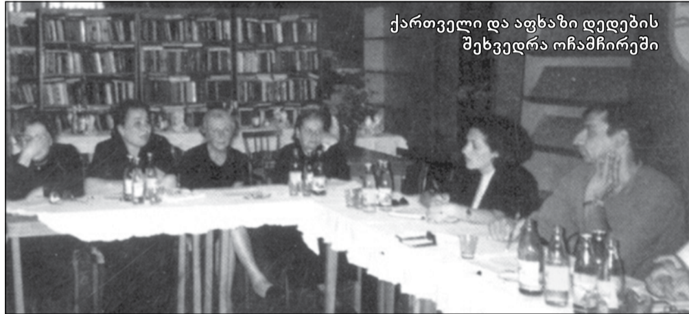
ქართველი და აფხაზი დედების შეხვედრა ოჩამჩირეში

საქართველოში ბოლო წლებში განვითარებული საომარი მოქმედებების შედეგად, ათასობით ადამიანი უზოუკვლოდ დაკარგულად მიიჩნევა. მათ შორის, 1 000-ზე მეტი სამოქალაქო პირია, რომელსაც სამხედრო დაპირისპირებაში არ მიუღია მონაწილეობა. რაც შეეხება 1992-93 წლებში, აფხაზეთში დაკარგულ მებრძოლთა რიცხვს, 870-ს აღემატება, ხოლო 2008 წლის აგვისტოს