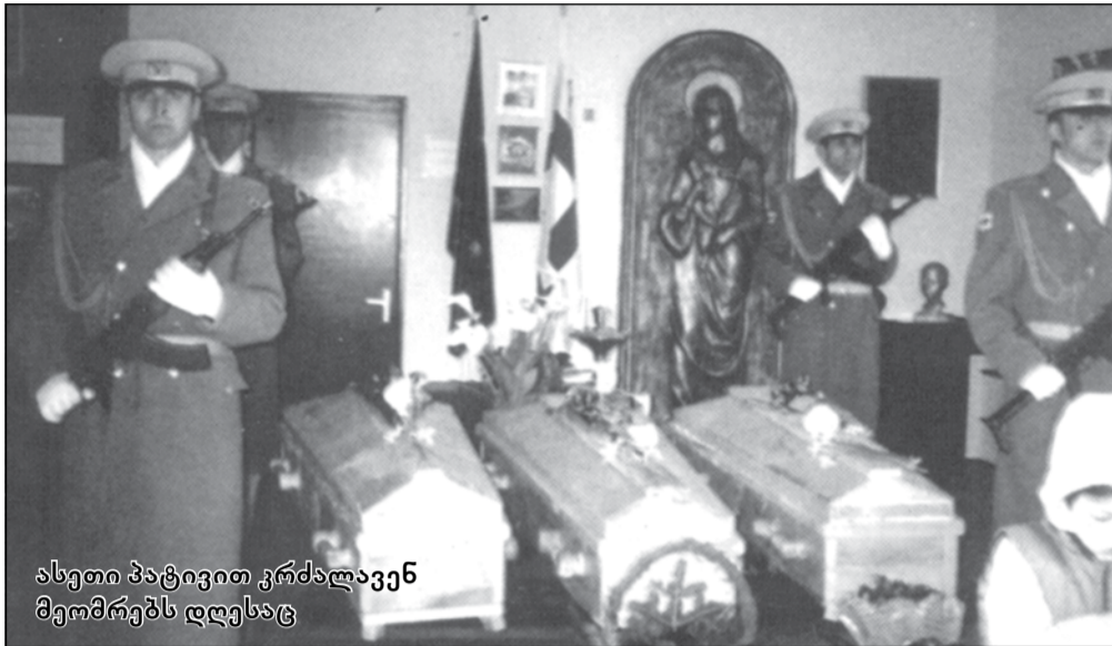
ასეთი ჰატივით კრძალავენ მემორებს დღესაც

„საკაშვილმა გმირებიც კატეგორიულად დაყო, მას თავისი გმირები ჰყავს“, — რთულია ეს ფრაზა იმ ადამიანებისგან მოისმინო, ვინც ოჯახის წევრები საქართველოს ტერიტორიული მთლიანობისთვის ბრძოლას შესწირა. უფრო რთული კი ისაა, როცა მსგავს სინანულს ისინი გამოთქვამენ, ვისაც შვილი, მეუღლე ან მამა ომში დაკარგული ჰყავს და დღემდე ეძებს. 1 ოქტომბრის არჩევნების შემდეგ, მათი პოზიცია ოდნავ შეიცვალა, მცირე იმედი გაუჩნდათ — უზოუკვლოდ დაკარგულთა მოძიებისა და გადმოსვენების პროცესი ახლა მაინც განახლდა, ამბობენ.