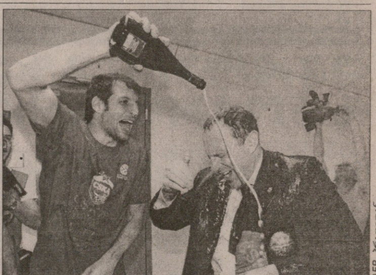
რუსული ცსკა-ს ევროჩემპიონობას ბერძენი თეოდოროს პაპალუკასი და იტალიელი ეტორე მესინა ხარობენ

არმიელთა სუპერცენტრმა დევიდ ან- დერსენმა მძიმე ტრავმა მიიღო და მოედანს სეზონის ბოლომდე გამოე- შვიდობა, ცსკა-ს ჩემპიონობას წყა- ლი შეუდგა. თუმც მესინამ მოახერხა გუნდის კონსოლიდაცია და ანდერსენს დირსეული შემცვლელი მოუნახა.