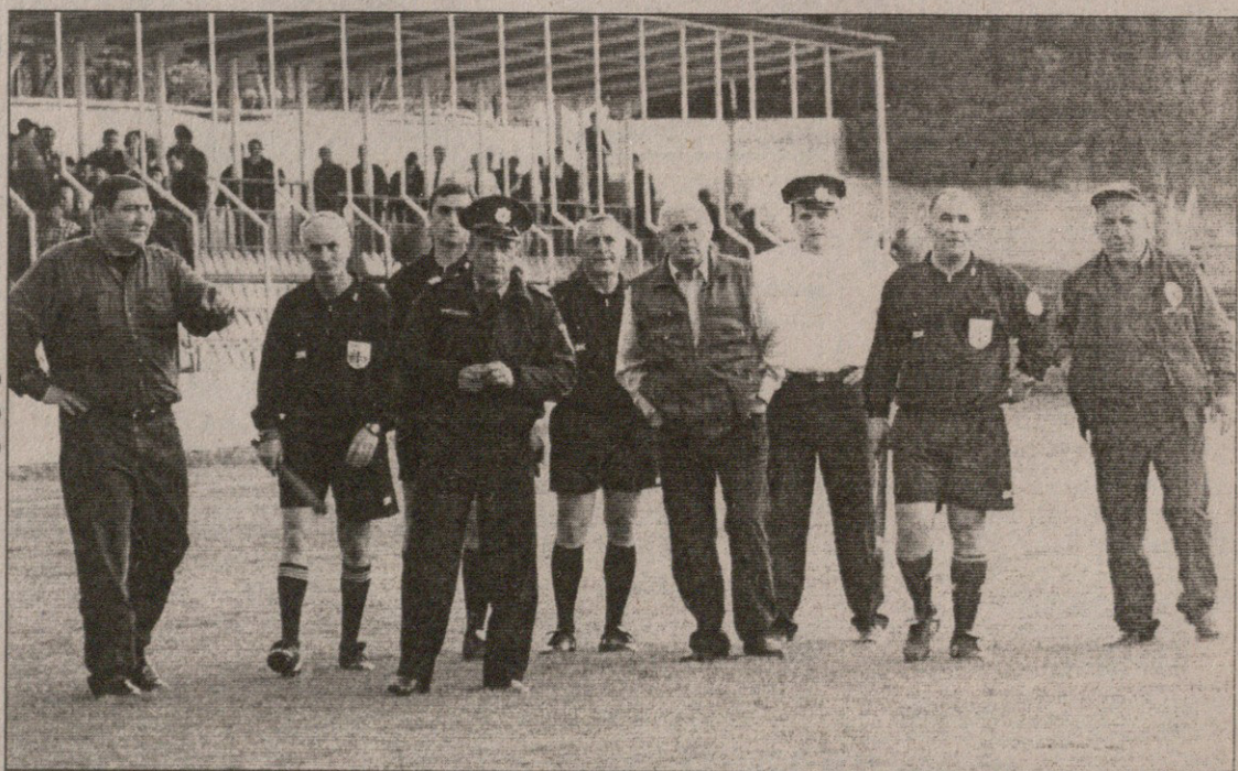
„დინამო“ მსაჯობით უმეყოფილო დარჩა