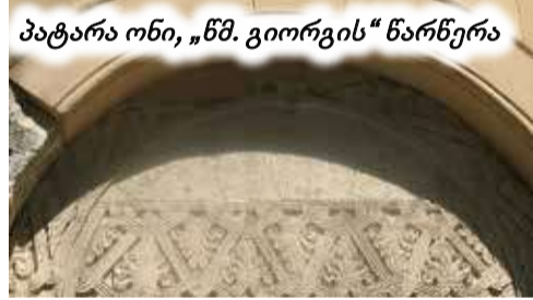
პატარა ონი, „წმ. გიორგის“ წარწერა