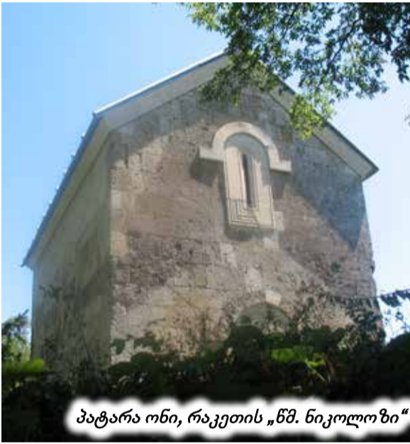
პატარა ონი, რაკეთის „წმ. ნიკოლოზი“

მეოხებითა წმიდისა ღმრთისმშობლისათა, წმიდისა ნიკოლოზისითა და წმიდა გიორგისითა, აღხოცენ ყოველნი ბრალნი მათნი ერისთავ კახასა და ადელაიდა დიოფალი და შეილნი მათნი ყოველნი დაიცვენ ყოველთაგან სავნებელთა, რომელთა აღაშენეს კარიბჭე ... ესე“. ეს წარწერა „წმ ნიკოლოზის“ მოშლილი კარიბჭისა ხომ არ იყო, და რესტავრატორებს აქ ხომ არ გადმოუტანიათ ძველადო, – ფიქრობს გ. ბოჭორიძე, მაგრამ ასე არ უნდა იყოს. წინააღმდეგ შემთხვევაში მასში წმ. გიორგის არ მოიხსენიებდნენ. რაც შეეხება ტექსტში „წმ. ნიკოლოზის“ არსე-