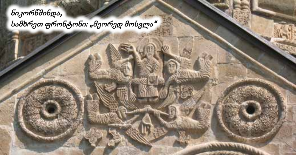
ნიკორწმინდა, სამხრეთ ფრონტონი: „მეორედ მოსვლა“

რეულო ტაძარს ააგებდნენ (მისი ნაშთები საძირკველის სახით ბარაკონის ახალი ეკლესიის სიახლოვეშია შენარჩუნებული), მანამდე პატარა ონში დასახლდნენ. ეს ის სოფელია, სადაც თავდაპირველად, დაუფუძნენ იუდეას ლტოლვილები, რომლებიც შემდგომში ამჟამინდელ ონში გადაბარდნენ. ერთი სიტყვით, მარგვეთიდან (კაცხიდან) რაჭაში გადასულ რატის სახლს ბინა პატარა ონში, საერისთავოს დასავლეთ საზღვართან, დაუდევს და იქ ორი ეკლესია აუგია: „წმინდა ნიკოლოზი“ რაკეთის უბანში და „წმინდა გიორგი“ – ოდნავ მოშორებით. „წმინდა ნიკოლოზი“ სოფლის იმ