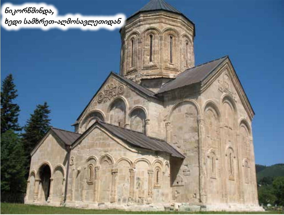
ნიკორწმინდა, ხედი სამხრეთ-აღმოსავლეთიდან

და წმ. თევდორე, ხოლო შუაში – მაცხოვარი. სწორედ ამ ტიპანს შემოუყვება ნახევარ-წრიულად მთავარი, კტიტორული წარწერა ასომთავრულით: „ქრისტე – ძეო ღმრთისაო, ადიდე სიმრთელით და დღეგრძელობით შენ მიერ გვირგვინოსანი ბაგრატ აფხაზთა და რანთა მეფე და ქართველთა კუროპალატი და გაზარდე ძე მათი გიორგი ნებისა შინა შენისა, მეოხებითა წმიდისა მღვდელთმოდლუარისა ნიკოლოზისაითა“. დასავლეთის კარიბჭის დასავლეთ კედლის 4-სტრიქონიანი წარწერა გვეუბნება: