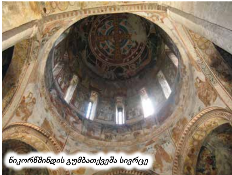
ნიკორწმინდის გუმბათქვეშა სივრცე

ახლა რაც შეეხება ფასადებისა და ინტერიერის მხატვრულ გაფორმებას: ჩუქურთმების თუ სიუჟეტური რელიეფების შესაფასებლად მორგებული იქნება სამხრეთ ფრონტონში არსებული კომპოზიციის სახელი „მეორედ მოსვლა“. ამ და სხვა რელიეფურ პანოებში ქანდაქარი დიდი ოსტატობით გადმოსცემს ფიგურათა ხასიათს და მათ ურთიერთდამოკიდებულებას. გიორგი ჩუბინიშვილის მოსაზრებით ნიკორწმინდის ჩუქურთმებსა და რელიეფურ პანოებს სამი ოსტატი კვეთდა ხუროთმოძღვრის დავალებით. მათ ინტენსიურად აქვთ ათვისებული არა მარტო კედლების სივრცობრივი სიბრტყე, არამედ კარებისა და სარკმელების გარშემოწერილობები, გუმბათის ყელი და კარიბჭეთა კამარა-გუმბათები, სადაც ფანტასტიური ფრინველები „ფაზკუჯი“, „სირაქლემა“, „ქათამვეშაპა“ ჩაბუდებულიან.