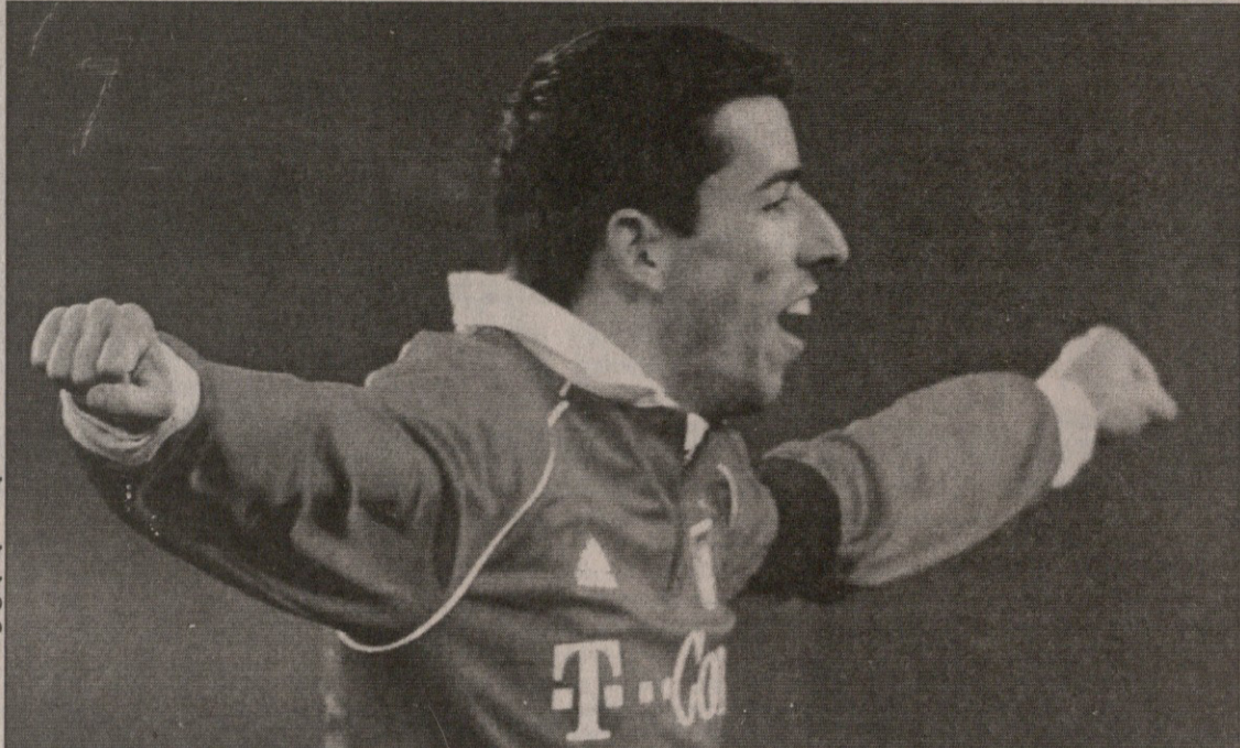
მიუნხენგალაბახი — ბაიერნი. მაკამ დუბლი მიითვა

გაფრთხილება: ნოინდორფი, ლაბა, ჩერუნდოლო, ტარნატი გაქვება: ლაბა (45) მსაჯე: შტარტი 33 740 მაყურებელი ლევიკოვანი 2:1 აინტრახტი 0:1 აპანატიდისი (41), 1:1 ფრაიერი (67), 2:1 ბუტი (74) ლევიკოვანი: ბუტი, ბ. შაიფერი, ფუანი, მადუნი, სტენმანი, რამელი, როლფსი (ფრაიერი 46), ბარნეტა, ატირსონი, ვორონინი (ბაბინი 84), ბერბატოვი (პაპადოპოლოსი 90) მწვრთნელი: მისხელ სკობე აინტრახტი: ნიკოლოვი, რემერი, კრისი, ვასოსკი, შპინერი (ოსხი 78), ჯონსი, პროსი (დური ჩა 82), კო- ლიერი (ვაისენბერგერი 57), ა. მიე- ერი, აპანატიდისი, კობადო მწვრთნელი: ფრიდშულტ ფუნკელი გაფრთხილება: სტენმანი, ბარნეტა, მე- იერი, ვასოსკი მსაჯე: ფანდელი 22 500 მაყურებელი შტუტგარტი 0:1 დუნისბურგი 0:1 კალიჯორი (43) შტუტგარტი: პილდერანდი, პინკლი (კრონიაიერი 65), ფ. მეირა, დელი- რი, მანინი, ტიფერი, გენტენი, მა- ისერი (გომეზი 46), პიკლშერგერი, ლეოპოლი, ტომასონი (კარევიჩი 70) მწვრთნელი: ჯოვანი ტრაპატონი დუნისბურგი: გ. კოსი, მიორლე, ბი- ლიშკოვი, ა. მაიერი, ვილი, ტიკუ- ზუ, კალიჯორი, ტარარახე, ლოტ- ნერი (ბელუმი 48), კურტი (ბოძევი 89), ლავრიჩი (ანი 86) მწვრთნელი: იურგენ კოლერი გაფრთხილება: დელიშკოვი, ტიფერი, კალიჯორი, ტარარახე, ლოტნერი, მაიერი, ტიკუზუ მსაჯე: გაგელმანი 31 000 მაყურებელი აინცი 4:2 კიოლნი 1:0 ტიურტი (5), 1:1 პოდოლსკი (31), 1:2 შერცი (49), 2:2 ტიურტი (55), 3:2 ზიდანი (6), 4:2 აუერი (87) აინცი: ვეტლო, ფერტი, მ. ფრიდ- ზი, ნოვსკი, ვაგელი, ო. ადო (რუმბი 66), ბეკოვი, და სილა, მ. ზიდანი (ნ. ვა- ლანდი 80), ტიურტი (ბელი 90), აუერი მწვრთნელი: იურგენ კლოპი