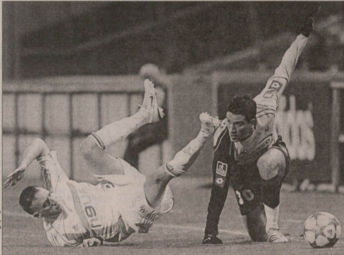
მარსელი — სოშო. აყირაგებულ ფრანგ რიბერის ჟან კალვე გაურბის

მძიმე ბრძოლა გადავიტანეთ. ახლა ისლა დაგვრჩენია, იმედი დაეიტოვოთ, რომ „ლიონი“ ქულებს დაკარგავს — თქვა ლასლანდმა.