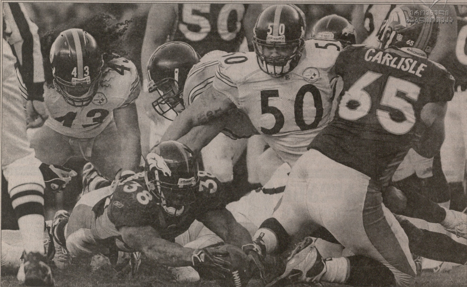
დენვერ, კოლორადო