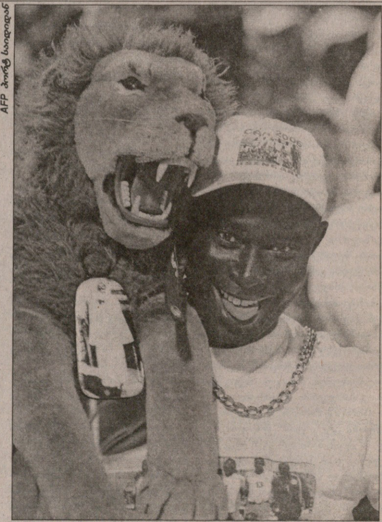
AFP პორტ საიდინ