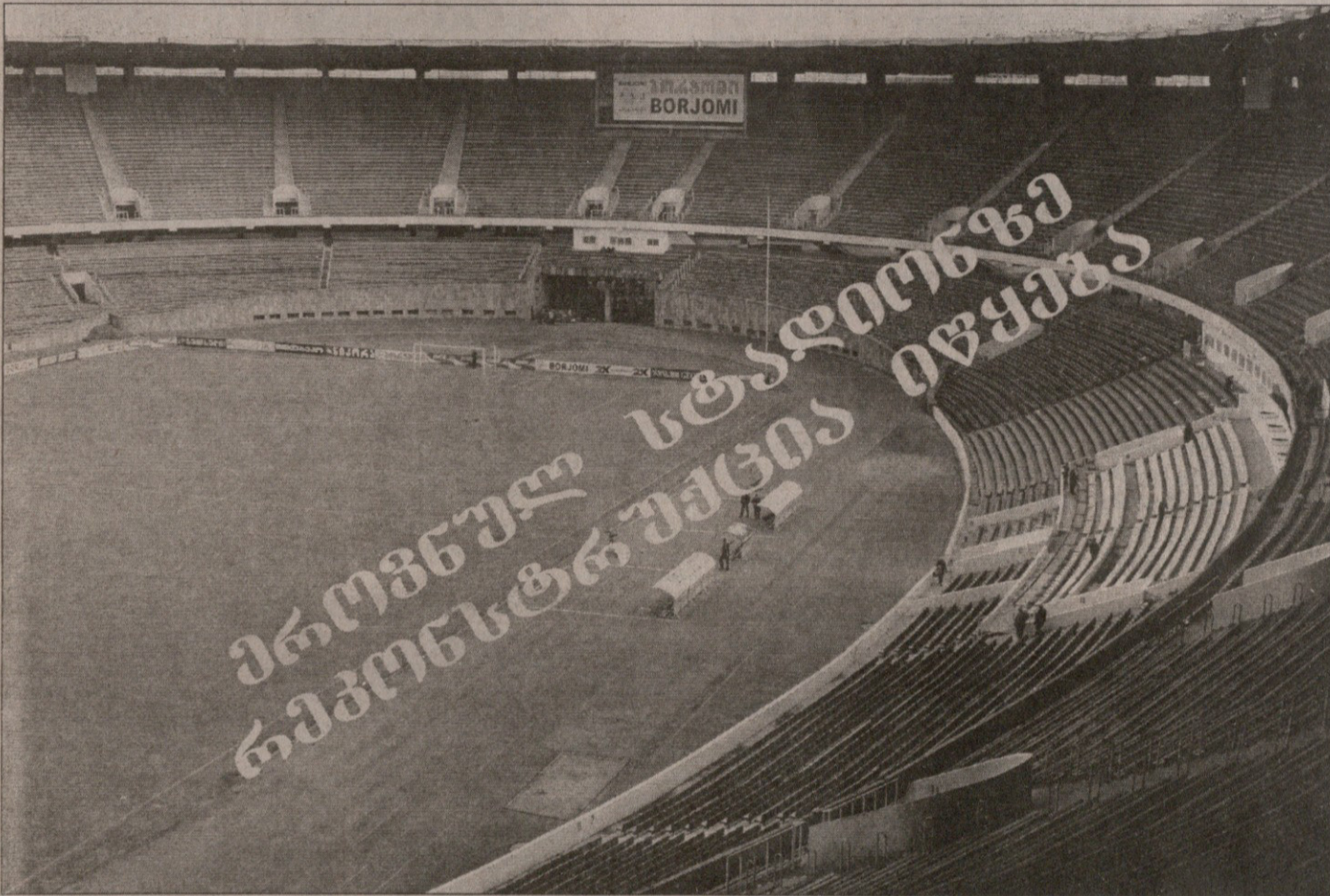
გადრი კათილასის ფოტო

ისეთი პირი უჩანს, გაპარტახებულ ეროვნულ სტადიონს მალე საშველი დაადგება. საქართველოს ფეხბურთის ფედერაციასა და „ეროვნულს“ აქციათა საკონტროლო პაკეტის მფლობელ თბილისის მერიას შორის კონსულტაციები უკვე დაწყებულია. გამაგრების სამუშაოები, ახალი მიწდვრის საფარი, ინდივიდუალური სკამები, განახლებული გასახდელეები და ლოჯა — წინასწარი გეგმით, განახლებულმა სტადიონმა უკვე სექტემბერში საქართველოს ნაკრების საშინაო შეხვედრებს უნდა უმასპინძლოს. საბოლოო გადანვეტილების ვადად თებერვლის შუა რიცხვებია დათქმული, „ევროემონტი“ კი თებერვლის მიწურულს დაიწყება.