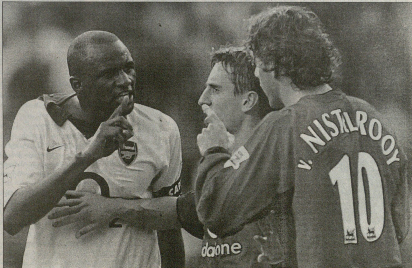
შარშან „ოლდ ტრაფორდზე“ დიდი გაწვევა მოწვევა იყო

გარდა ამისა, ეს ნახევარმცველთა ომია. ვნახოთ ოთხეულები და ვიფიქროთ. საერთოდ კი ეს დაუსრულებელი ისტორიაა, მაგრამ ამ ისტორიას ბოლომდე ვერ შეივრძნობ, თუ მისი წინა ისტორია არ იცი, მის გაგებას კი მხოლოდ დიდი მატჩის ორი ბილეთი არ ეყოფა.