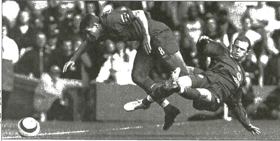
ლივერპული — მანჩესტერი. ლივერპული სტივენ ჯერარდი და მანჩესტერელი უეინ რუნი დამატებით

ტოტენჰემი: რობინსონი, კინგი, სტა-ლტერი, გარდერი (ნაიბეტი 39), ჯე-ნასი, ლი, კარკი, ტაინიო, რიდი (რობინი კინი 67), რასიაკი, დეფო