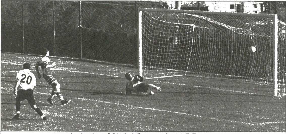
დავით სევასტოპოლომ (№20) ცხინვალელთა მეკარეს შანსი არ დაუტოვა

თბილისი. 17 სექტემბერი. 16 საათი. აშშ-ის 900 (ტევადობა 900)