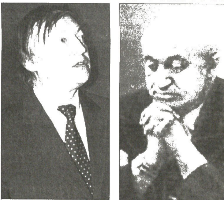
კარპოვმა ძველი მეგობარი გაიხსენა

ბუენოს-აირესში ცნობილი არგენტინელი დიდოსტატის მიგელ ნაიდორფის სახელობის XVI საერთაშორისო საჭადრაკო ფესტივალი დაიწყო. ტურნირზე პლანეტის მე-12 ჩემპიონი რუსი ანატოლი კარპოვიც გამოდის და სახელოვან დიდოსტატთან გატარებულ დროს იხსენებს.