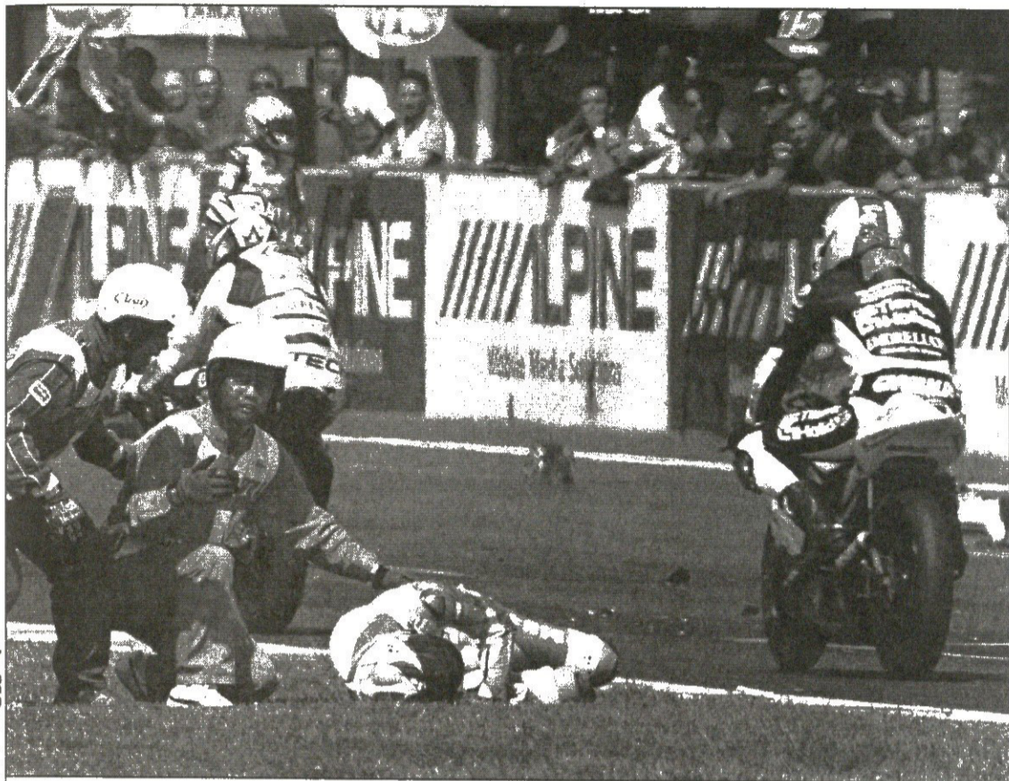
იაპონიის დიდი პრიზის გათამაშება კინალამ ტრაგედიით დასრულდა