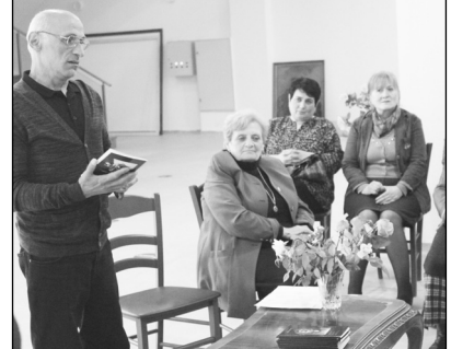
მძიმე ხვედრი და მისი მოწამობრივი ცხოვრება. წიგნის განხილვაში მონაწილეობა მიიღო და საკუთარი აზრი გამოთქმეს მოწვეულა სტუმრებმა.

20 მაისს, ოზურგეთის ისტორიულ მუზეუმში მუზეუმების საერთაშორისო დღისადმი მიძღვნილი კვირეულის ფარგლებში, გაიმართა მანანა ლომაძის წიგნის პრეზენტაცია-ეკატერინე გურიელის მარტვილობა. წიგნი ასახავს ცარისტული რუსეთის რეაქციული რეჟიმის წინააღმდეგ მებრძოლი პატარა გურიის დედოფლის- სოფიოსა და მისი შვილების მწარე ხვედრს. თუ როგორ გააუქმა ცარისტულმა რუსეთმა გურიის სამთავრო და მიიერთა იგი დანარჩენ საქართველოსთან ერთად. წიგნი ასახავს გურიის უკანასკნელი მთავრის მამა V გურიელისა და დედოფალ სოფიოს ქალიშვილის, ეკატერინეს მოწვეულა სტუმრებას.