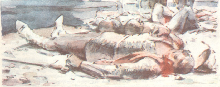
მხატვარი თამაზ ხუციშვილი