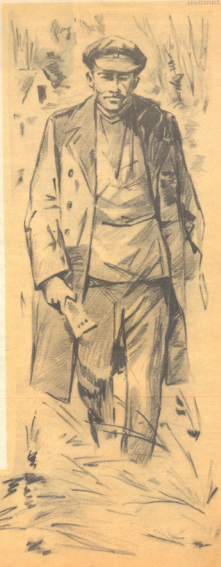
ქ. შარჭიის ნახ. სივ. სივ.

ძალიან დალონდნენ, გავიდნენ გზაზე და დიდახს იურებოდნენ იქით, საითაც თურმე ლენინი გაემგზავრა.