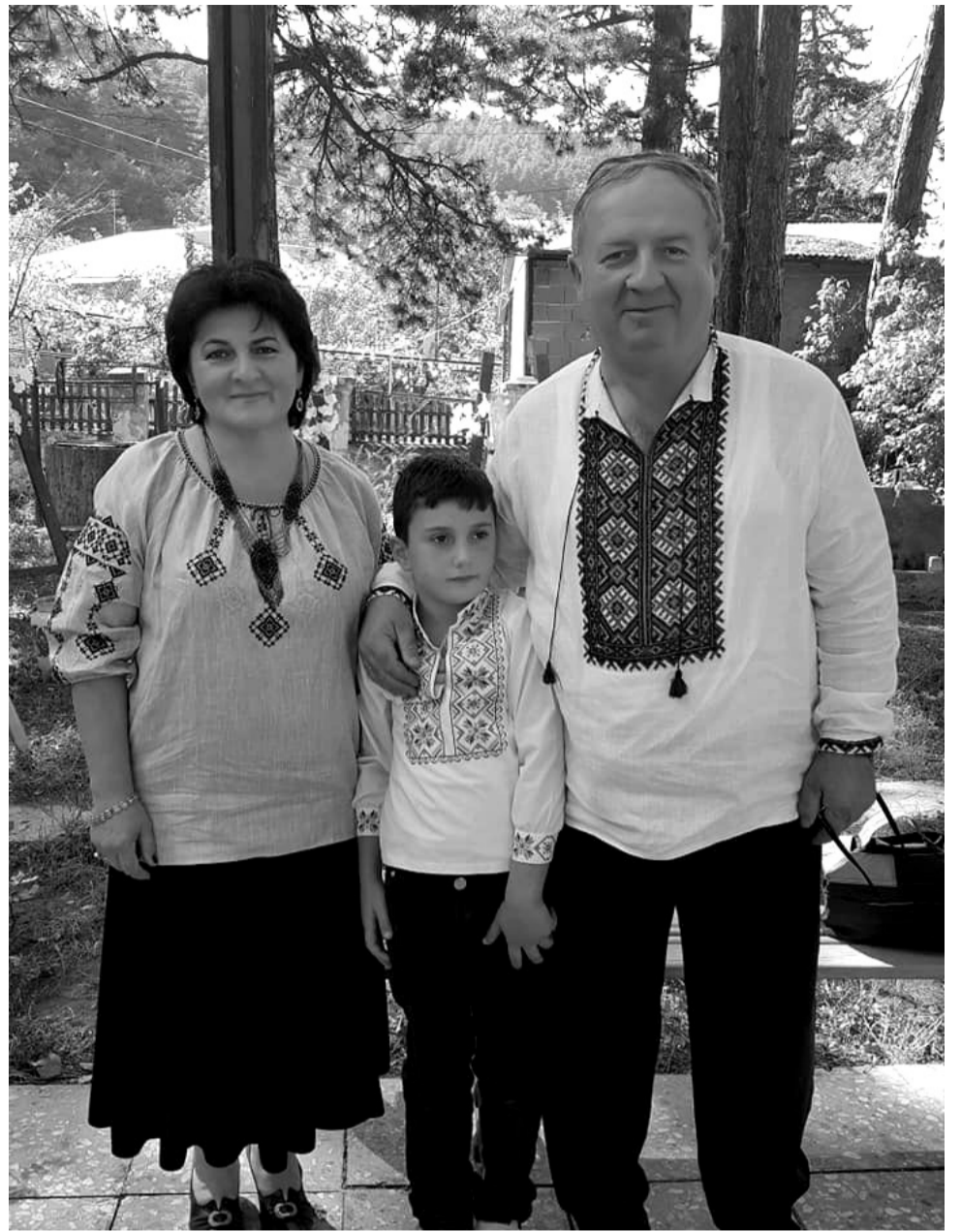
მუზეუმის აღდგენაზე, რომელიც 2014 წელს უკრაინაში საომარმა მოვლენებმა შეაფერხა და 2020 წლიდან განახლდა.

ტარიელ გოგოლაძე დაიბადა სურამში, 2002-2003 წლებში იყო ხაშურის რაიონის ასოცირებული საკრებულოს თავმჯდომარე, უფრო ადრე, 1996 -2007 წლებში არჩეული იყო სურამის გამგებლად და საკრებულოს თავმჯდომარედ. 2007 წლიდან ლესია უკრაინკას საზოგადოების თავმჯდომარეა საქართველოში. სწორედ ამ პერიოდში დაიწყო ფიქრი ლესიაობის დღესასწაულის აღდგენაზე, რომელიც სურამში ყოველწლიურად, შემოდგომაზე აღინიშნება. უკრაინელმა პოეტმა ქალმა ლესია უკრაინკამ (ლარისა კოსაჩმა), სიცოცხლის უკანასკნელი დღეები დაბა სურამში გაატარა. მას ეკუთვნის სიტყვები, რომლებიც დღესაც მოწოდებასავით გაისმის: „მე რომ უკრაინელი არ ვიყო, ვისურვებდი