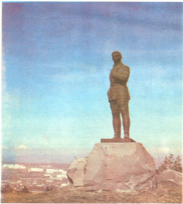
გორის ძნელაძის ქალაქი კომკავშირული ქალაქ ბ. ძნელაძეში.

აი თურმე რა ყოფილა! 2017 წელსო... წარმოგიდგე- ნით? იქამდე თითქმის ნა-