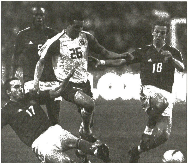
ფილიპ დეგენს და შვეიცარიელებს მასპინძლებმა ვერაფერი დააკლეს

IV აგვისტო საფრანგეთი 0:0 შვეიცარია საფრანგეთი: ბარტეზი, სანიოლი, ბუმსონგი, გივე, გალასი, ვიერა, პედრეტი, ჟიული, დორასო (მერიემი 59), ტრეზეგეტე, ვილტორდი (გოვუ 82) შვეიცარია: რაიმონ დომენიკი შვეიცარია: ცუბერბიულერი, დეგენა, სენდეროსი, პ. მიულერი, შპიბერი, ლონფატი (პუგელი 28), ფოგელი, გიგაქსი (ანშო 90), კაბანასი, ციგლერი, ა. ფრი მსაჯი: იაკობ კუნი მსაჯი: მასიმო დე სანტისი (იტალია) 79 373 მყურებელი