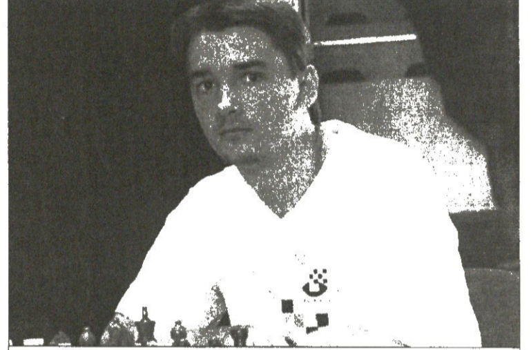
ტოპალოვთან სწრაფმა მოგებამ მოროზევიჩის მეორეობა შეუნარჩუნა

იერიშებში და ხიჯვა-ყლეუტანში წარმართა სწრაფი პარტია, და იგი 33-ე სვლაზე შავებით მთამაშე მოროზევიჩის გამარჯვებით დასრულდა. ამ ქელამ ოქტის მკორეობა შეუნარჩუნა.