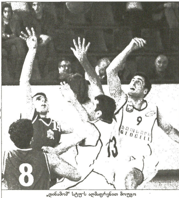
„დინამო“ სტუს აღმაფრენით მოუგო