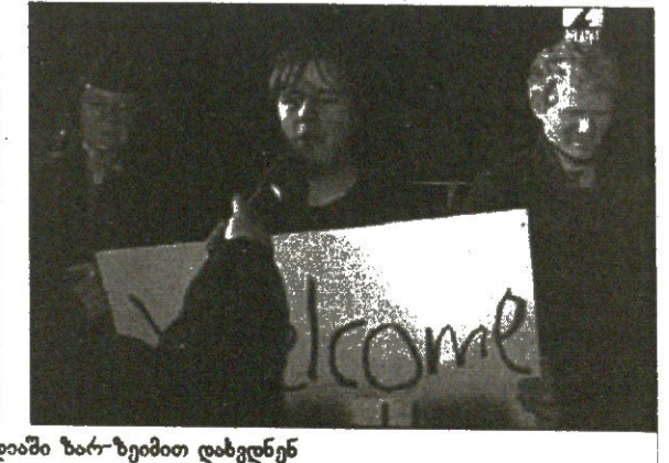
ბობი ფიშერის ისლანდიაში ზარ-ზემით დახვდნენ