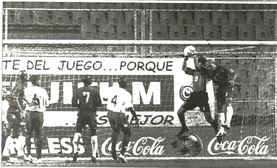
ვენესუელა — კოლუმბია. მატჩი რომ უფოლოდ დასრულდა, ამ ფოტოდანაც კარგად ჩანს