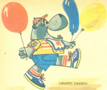
პატარა დიდი ბავშვი