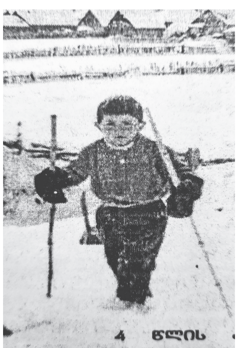
თან ერთად ახტუნებდა.

ბავშვობაში ოჯახს უჭირდა და ცხვარ-ძროხას მწყემსავდა. მამა გააკულაკეს, მერე დაიჭირეს, გადაასახლეს, 36 წლისა გარდაიცვალა. ობლობაში გაიზარდა. დედას ედგა მხარში და ეხმარებოდა. შრომა არ ეზარებოდა და მამის აღერს მოკლებული, დედის, ბიძის და ახლო ნათესავების დახმარებით იზრდებოდა. 6-7 წლის ყმანვილი თავის ტოლ ამხანაგებთან ერთად დასდევდა შეკრებაზე ჩამოსულ სპორტსმენებს, სამხედროებს, აკვირდებოდა მათ ვარჯიშებს, იმხანად ისინი ძველ ტრამპლინზე ვარჯიშობდნენ... გამოცდილი სპორტსმენებისგან ბევრს სწავლობდა. მისი პირველი მწვრთნელი და მასწავლებელი არამ ადამიანიც 5-10 მეტრიან ტრამპლინზე სხებ-