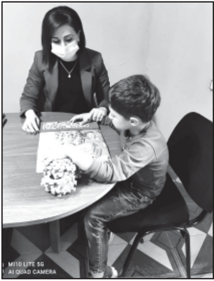
MiD Lite S6 AI Quad Camera

სხელშეწყობას. აქტიურად ვმუშაობთ მშობლების ფსიქო-ემოციური გაძლიერების მიმართულებით. ბავშვისა და მშობლების საჭიროებებიდან გამომდინარე, მუშაობის პროცესში ჩართულია სხვადასხვა სპეციალისტი: ფსიქოლოგი, სპეციალისტი, სპეც.პედაგოგი, სოციალური მუშაკი, მეტყველების თერაპევტი, რეაბილიტოლოგი.