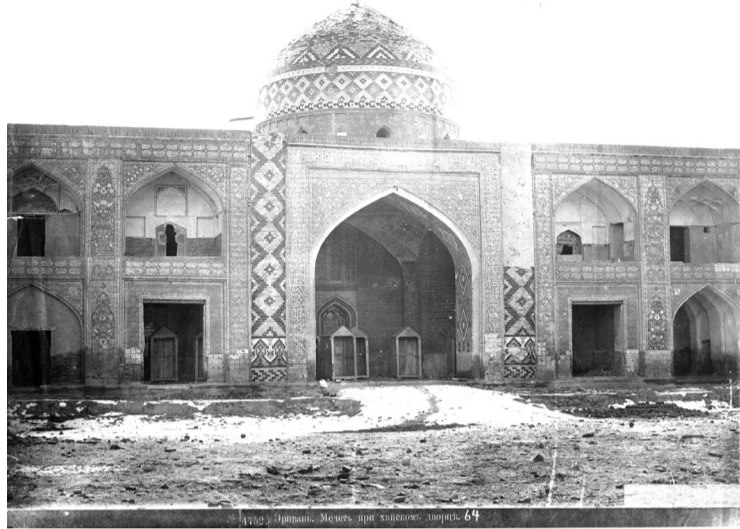
1912 წ. ერევანი. მეჩეთი, ნაგებობის ნაშთი. 64

თბილისში არაბები, სპარსელები, თურქები, საუკუნეების მანძილზე ბატონობდნენ. რა თქმა უნდა, მათი ბატონობა ქართველ ხალხს გულზე არ ეხატებოდა, მაგრამ მათ მიერ ამენებულნი მეჩეთები და საეკლესიო ნაგებობანი, დღესაც დგანან. მათი ბატონობის დროს შექმნილი ტოპონიმები: ნარი-ყალას, სეიდაბადის, ორთაჭალის და სხვათა ნაშლა და ქართული შეცვლა საქართველოს არცერთ მთავრობას არ მოსვლია ფიქრად. ძველ ეპოქაში, ერთ-მანეთის გვერდით, დღესაც დგას ქართული მართლმადიდებლური ტაძარი, კათოლიკური და სომხური ეკლესიები, მეჩეთი და ებრაული სინაგოგა. ისინი თბილისის ისტორიის ორგანული ნაწი-