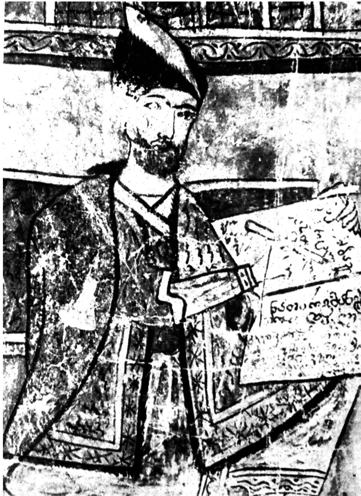
არსებული შოთას პორტრეტის ადგილის დადგენა

გვარი შოთასძე (შოთაშვილი) რომ სახელ „შო-