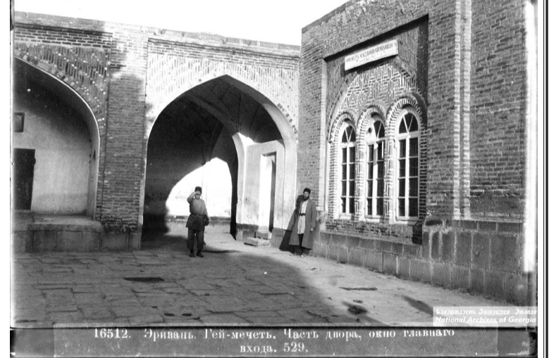
16512. Эривань. Гей-мечеть. Часть двора, окно главного входа. 529.

აქვე აღვნიშნავ, რომ სომხური მხარე ხანის სასახლის განადგურებას რუსებს აბრალებს, თითქოს, 1827 წელს, ერევნის ციხესიმაგრის აღების დროს, დაზიანდა. შეიძლება, გარკვეულწილად, მართლაც დაზიანდა, მაგრამ არ განადგურებულა. ამას მოწმობს დ. ერმაკოვის მიერ გადაღებული ხანის სასახლის შიდა და გარე ინტერი-