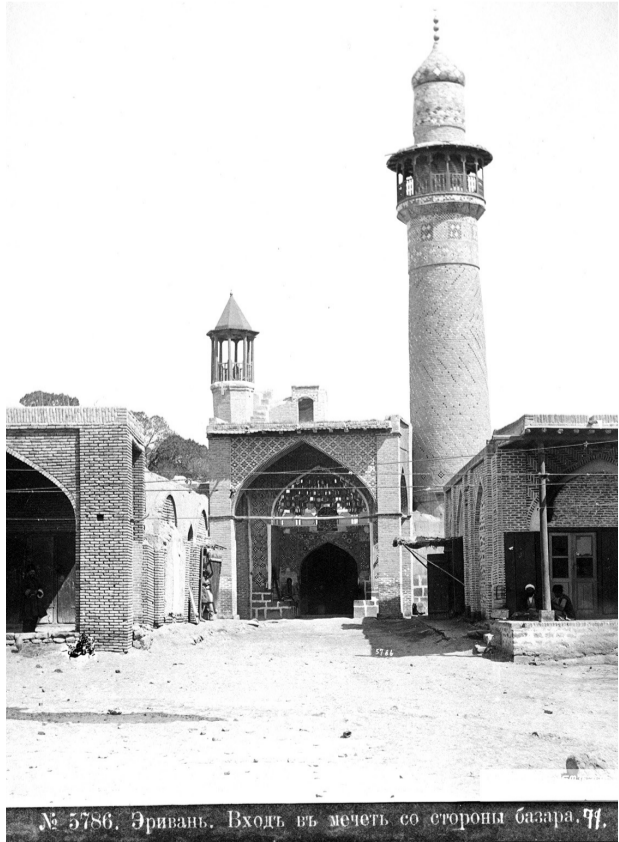
№ 5786. Эривань. Вход в мечеть со стороны базара. 77.