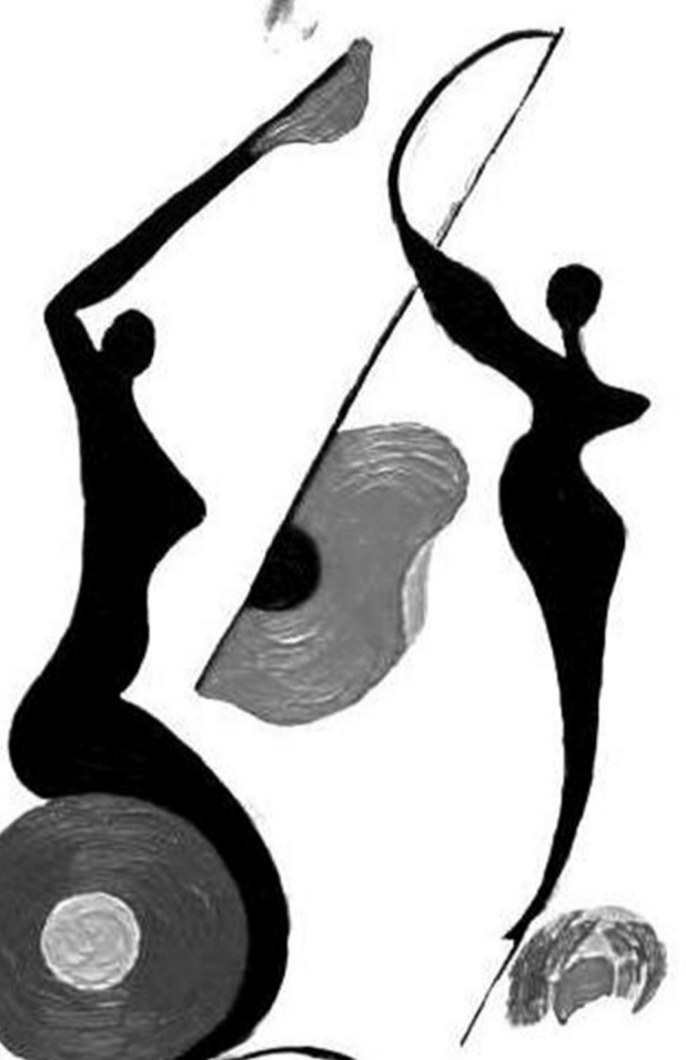
გიორგი აბაქიშვილის ნახატი

გამოუხსნელ ულულს შეება, რომ არ შენახა - ჩრდილების სმით - მისი ღვიძლივით გადიდებული და გაჭრილი ის ღამეები. აქეთ მოინი, საყინულედან, მანდ, შეიძლება, დგას შედეგივით უეჭველი ქსელი ობობის, რომლის მიზეზი მნიშვნელოვნად არ შეიცვლება, როგორც მიზეზი - მოარული ავადმყოფობის. როგორ მინდოდა, ცოტა ადრე წყეულ წყენაზე, - მისი გრძელი და სიყვარულზე სუსტი თითები მე ჩემს თვალბეჭდს, უპრობლემოდ