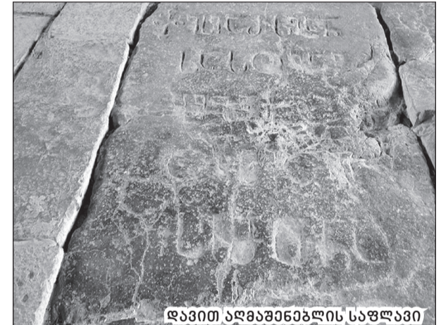
დავით აღმაშენებლის საფლავი

თუ ამ სახელწოდებას გრამატიკულად გავეშივრავთ, შემდეგს მივიღებთ: „საქართველოს მამინდელი საქეთმკვრიბელთაგან ახლად დაარსებულ აკადემიას ებრძანა: „განათე!“ ე.ი. ლამაზაძე აენთე და