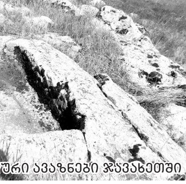
ნაწმერთული ღმერთული ავაზანები ჯავახეთში

წელს, როგორც თითონი წერს, ე.ი. 2017 წელს. 7 წლის წინ ახალი არ არის. სინამდვილეში მე აღარ მქონდა სასაჩუქრედ და იმდრო ვერ მივეცი მას „ჭაბრები და სახლები“. ასეც რომ არ ყოფილიყო, ამონაბეჭდის გაწვევება მიღებული ფორმა სამეცნიერო ნიშნები და ამაში ცუდს ვერაფერს ვხედავ, ამიტომ არასწორია ვ. სამსონიძის ეჭვები, თითქოს მე მას „შენიშვნა“ მივეცი ამ შესახებ. იგი წერს: „ნიგნის ავტორის სურდა „შენიშვნა“ მოეცა ჩემთვის, რომ მე არასწორად ვაღმოვცემ ჩემი სოფლის ადგილი ახსებულს“.