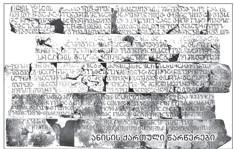
ანისის ქართული წარწერები

დასასრულს ვიტყვი, გ.ჭიჭინაძის სახით ქართულ საისტორიო მეცნიერებას დიდად ერუდირებული და ქართული ეროვნული სულით გაუღნითილი მეცნიერი უყავს.