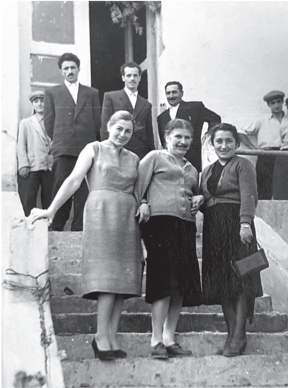
ასპინძის საშუალო სკოლის პედაგოგები. 1960 წელი.