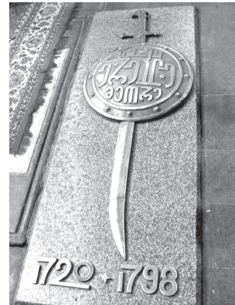
ყო. ქართველები ისე შეებნენ ომს, რომ პირველს დღეს, როცა რუსის ჯარიც უნდა ჩარეულიყო საქმეში, გენერალი

ამის შემდეგ მოხდა ჯარისა და დიდებულთა ფიცი, ანუ აღთქმის დადება ერთგულებაზე და ჯარის წინ მდგროთ ბრძოლაზედ.