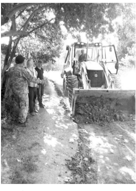
დაზოგადოების ფინანსური ხარჯები. ასევე, მუნიციპალიტეტის სოფლების მოსახლეობის მოთხოვნით სოფელ ძველში, ქობარეთში, დამალაში, იდუ-მალასა და აწყვეტაშიც განხორციელდა ანალოგიური სამუშაოები.

აღნიშნული პროექტის განხორციელების საქმეში აქტიურად იყვნენ ჩართულები ამავე სოფლის მაჟორიტარი დეპუტატი და მერის წარმომადგენელი. სამუშაოები შესრულდა ასპინძის მუნიციპალიტეტის მერიის საკუთრებაში არსებული ტექნიკის გამოყენებით, რამაც მნიშვნელოვნად