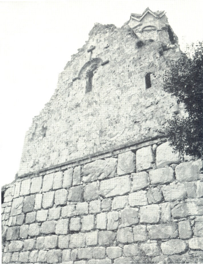
Porta (Khandztha ?). Église Saint-Georges (X e -XII e siècle). Façade Est reposant sur le socle de nivellement.