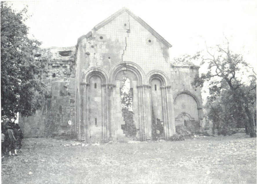
Tbeti, vue générale.