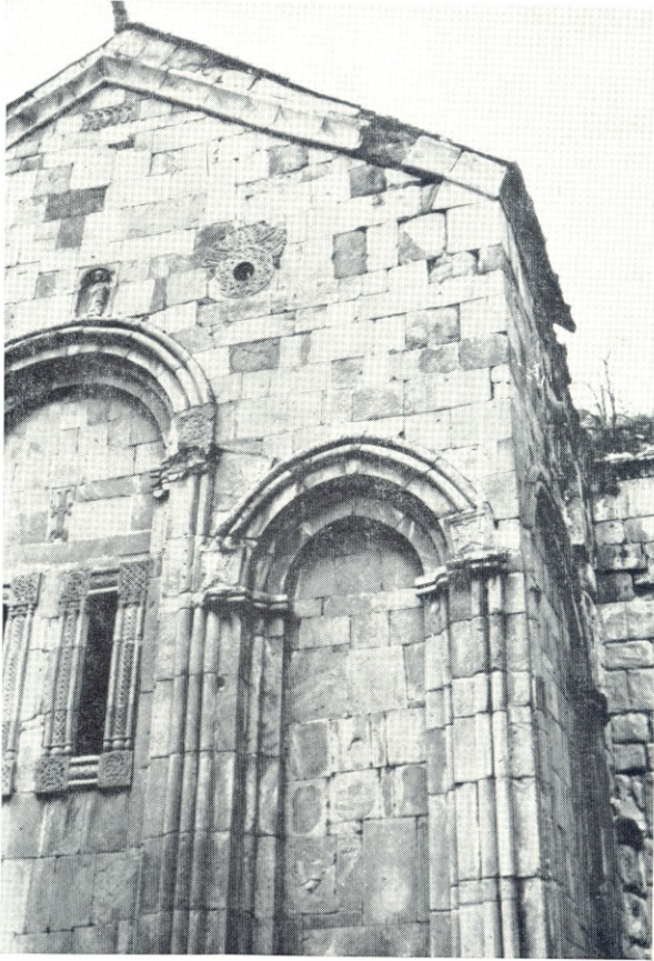
Tbeti. Église de la Vierge (?) (X e -XII e siècle). Bras Sud.