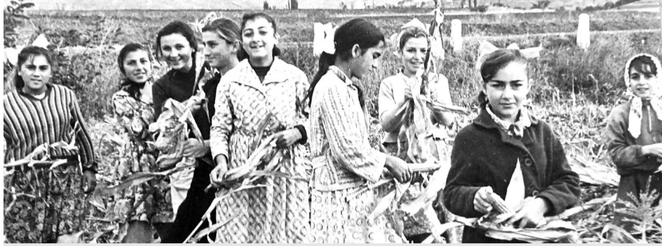
1963 წელი. ასპინძის საშუალო სკოლის მოსწავლეები ასპინძის კოლმეურნეობაში სიმინდის აღების დროს