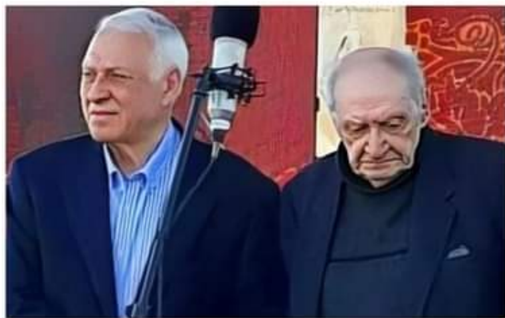
მართალია, ხელისგულზე სატარებელი ქართველები გადასახლდნენ საუფლოში და დარჩა სიციარიელე. მაგრამ სახედავროდ, მათი მემკვიდრეობა უკვდავყოფს თითოეულს და ამიტომაც სიციარიელე აღარ გამოინდება. მადლობა უფალს, რომ არსებობდნენ თემურ ნიკლაური, ზურა დოჩანაშვილი, ანზორ ერ-

დიდი სიყვარულით, სინრფელით, უბრალოებით, პატიოსნებით... თითოეული ჩვენგანი ლეგენდის თანამონაწილენი ვახდით და მადლიერებისა და მადლობის ნიშნად ტაშითა და გულიდანწამოსული უთბილესი სიტყვებით ვაგაცილეთ მწერალი... უსაყვარლესმა პოეტმა ტარიელ ხარხელაურმა ბრძანა: „კლდეებს ნანყულუქვით ნისლით ვუხვევდი, ცაო, როგორ მგლიშენი უფლობით, ნუხელ სიკვდილი მენვა მუხლებზე, და მე და ქარი ვჭირისუფლობდით... ...ველარც მზის მოსვლით ვერ შეივსება ეს შემზარავი სიცარიელე“.