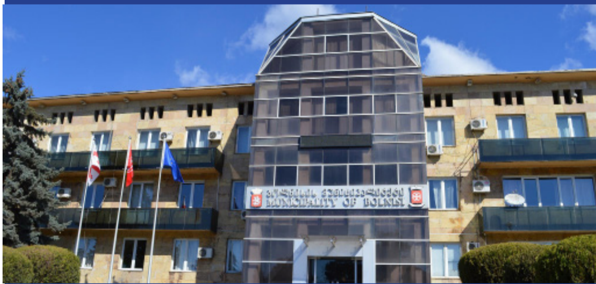
ბოლნისის ახალი მოწვევის საკრებულომ პირველი სხდომა ჩაატარა 3 დეკემბერს, ბოლნისის მუნიციპალიტეტში, მეშვიდე მოწვევის საკრებულოს

36 წევრიან საკრებულოში, 12 მაჟორიტარული, 24 კი პროპორციული სისტემით არჩეული წევრია. სხდომაზე დაკომპლექტდა ხუთი კომისია და მოხდა ამავე კომისიების თავმჯდომარეების არჩევა. ფარული კენჭისყრის პროცედურებში მონაწილეობა არ მიიღეს ნაციონალური მოძრაობის წევრებმა.