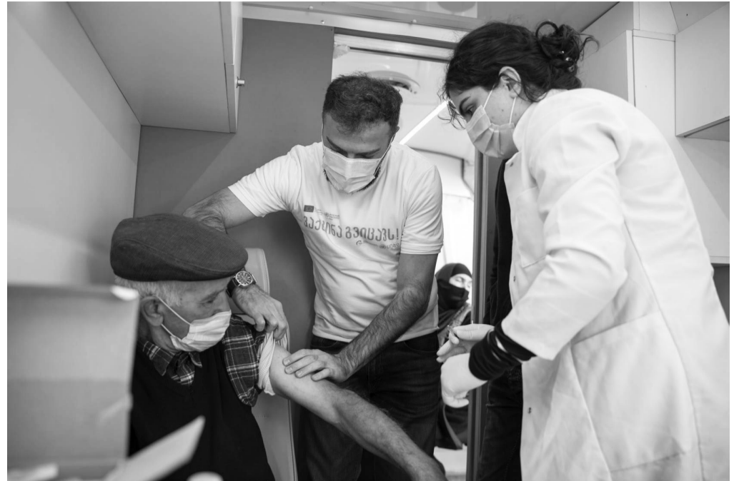
მუნიციპალიტეტში ოთხი მუდმივ მოქმედი ამცრელი დაწესებულება, საჭიროებიდან გამომდინარე კი სამი მობილური ბრიგადა სხვადასხვა სოფლებს მოიცავს. იმუნიზაცია ბოლნისის მუნიციპალიტეტში, ქვეყანაში არსებული სამი ვაქცინით: ფაიზერით, სინოფარმითა და სინოვაკით მიმდინარეობს.

გაუარესებული ეპიდემიოლოგიური ვითარებიდან გამომდინარე, ბოლნისის