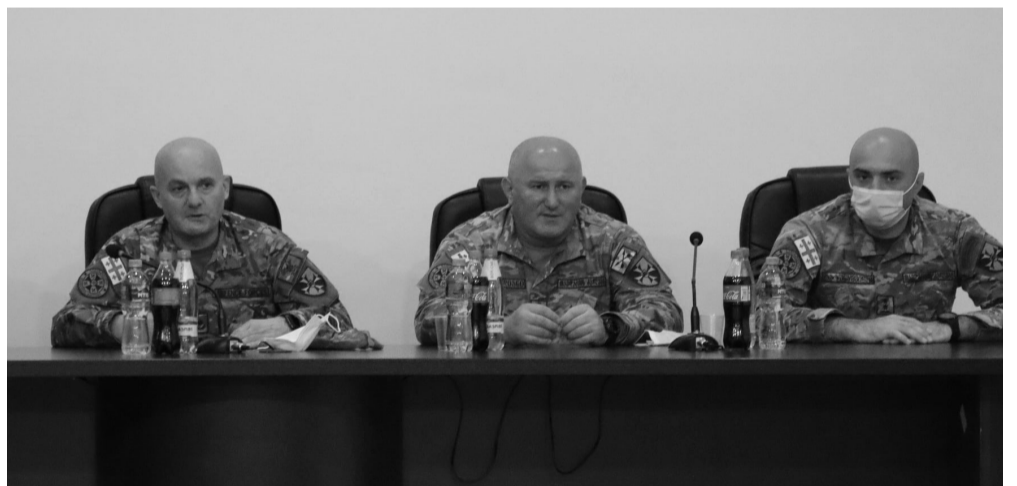
რეზერვში ჩარიცხვის მსურველებს შეუძლიათ გაიარონ ონლაინ რეგისტრაცია ვებ გვერდზე- onlinebct.mod.gov.ge

რეზერვში ჩარიცხული რეზერვისტის მინიმალური წლიური ანაზღაურება შეადგენს 2700 ლარს.