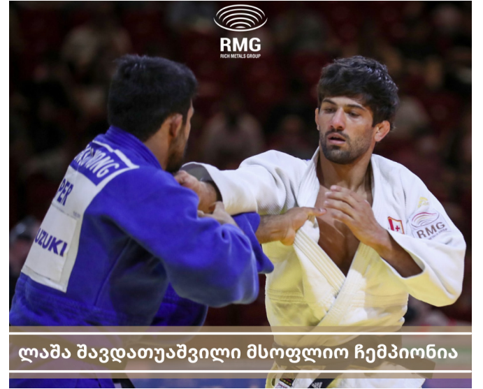
ლაშა შავდათუაშვილი მსოფლიო ჩემპიონია

ლაშა შავდათუაშვილი დამოუკიდებელი საქართველოს ისტორიაში პირველი ძიუდოსტი გახდა, რომელიც ოლიმპიადის, ევროპისა და მსოფლიოს ჩემპიონია. არემჯი ქართველი ჩემპიონების მხარდასაჭერია.