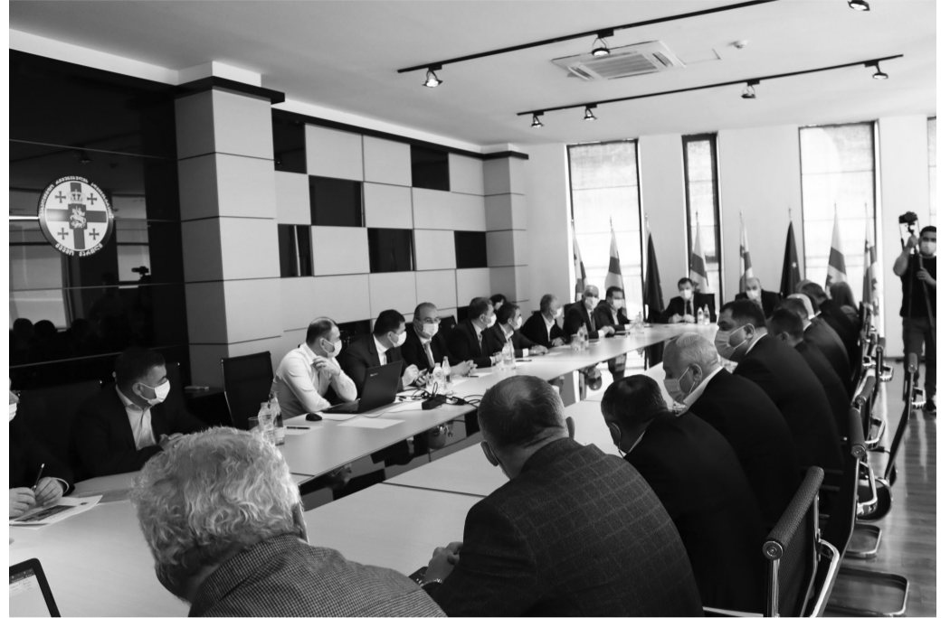
პროგრამის ფარგლებში, კომისიის სხდომები უკვე გაიმართა დასავლეთ საქართველოს ყველა რეგიონში და კახეთში.

პროექტები განხორციელდება, როგორც სახელმწიფო ბიუჯეტის დაფინანსებით, ისე საერთაშორისო საფინანსო ინსტიტუტების მხარდაჭერით.