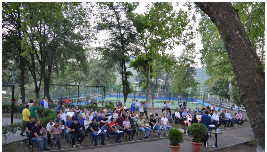
რთული გამოწვევის წარმატებით დაძლევის შემდეგ, როგორც მთელი ქვეყანა, ასევე ბოლინის მუნიციპალიტეტიც წელ-წელა ჩვეულ რეჟიმს უბრუნდება.

ეპიდემიოლოგიური თვალსაზრისით საქართველოს მასშტაბით ყველაზე მეტად დაზიანდა ბოლინის მუნიციპალიტეტი, აქ სულ 192 კოვიდ ინფიცირებული დაფიქსირდა, სამწუხაროდ 4 გარდაიცვალა, დანარჩენი კი გამოჯანმრთელდა.