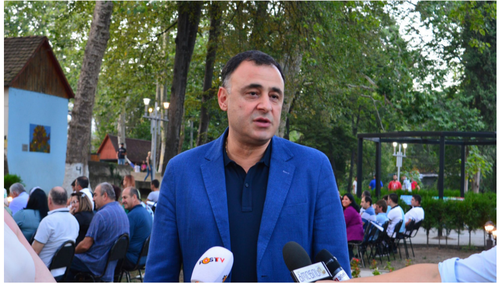
შეუფერხებლად განაგრძობდნენ მუშაობას ადგილობრივი საწარმოები.

კარანტინის პერიოდში ჯანდაცვის სამინისტროს რეკომენდაციების გათვალისწინებით მუნიციპალიტეტში აქტიურად მიმდინარეობდა ინფრასტრუქტურული სამუშაოები და