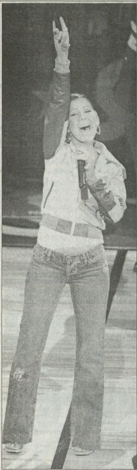
REUTERS ლოს ანჯელესიდან

ლოს ანჯელესის „სტივლს სენტერში“ ენბიეს დასავლეთისა და აღმოსავლეთის „ოლ სტარი“ გაიმართა, რომელიც კვლავაც დასავლეთმა მოიგო 136-132, საუკეთესო კაცად კი შაილ თნილი გამოდგა. შოუ ფრიადი იყო, ამერიკის ჰიმნს კრისტინა ავილერა აგუგუნებდა, სიყვარულის ჰანგებს კი მკვრივი ბეიოანსი. რა თქმა უნდა, იქ იყო კალიფორნიის გუბერნატორი არნი შვარცნეგერი, რომელიც ჩინელ გოლიათს, იაო მინგს ებღღვნა.