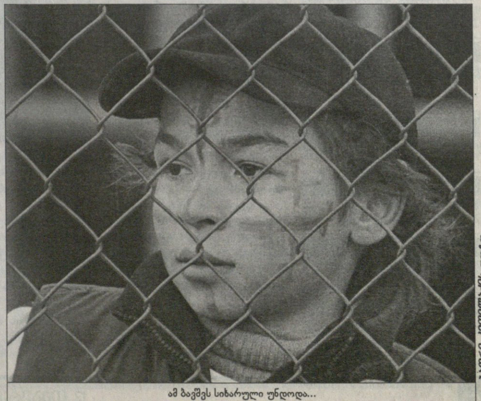
ამ ბავშვს სიხარული უნდოდა...

კონფერენციას არ ესწრებოდნენ რაგბის კავშირის ხელმძღვანელები, შეკრებილები კი მათ მიმართავენ. კონფერენციის დასკვნა და ქართული რაგბის მოთხოვნა ასეთია — ერთ თვეში დაინიშნოს რიგგარეშე ყრილობა და რაგბის კავშირის პრეზიდენტის ხელახალი არჩევნები.