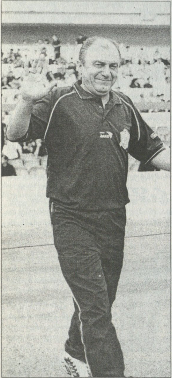
მერაბ ჟორდანიას ფოტო

ფაქტობრივად, უკვე გადამწყვეტილია, საქართველოს ეროვნულ ნაკრებს უკრაინელი ანატოლი ბიშოვეცი უთავადაცვებს. მას გუშინ საქართველოს ფეხბურთის ფედერაციის პრეზიდენტი მერაბ ჟორდანიაც შეხვდა. მოლაპარაკებით ორივე მხარე კმაყოფილია. ბიშოვეცს საქართველოში საკმაოდ ჰყავს მეგობრები, მათგან ერთი „დინამოს“ სპორტული დირექტორი ბიპი ნოდია.