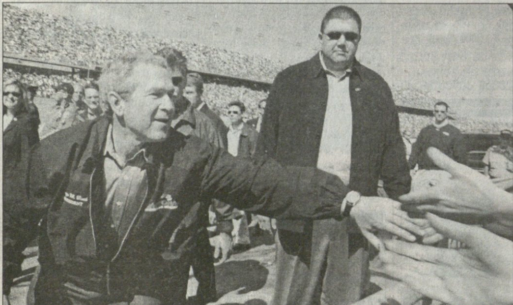
დაიტონა ბიჩიდან

პრეზიდენტი ბუში თავის საარჩევნო კამპანიას ფლორიდაში აგრძელებს. სწორედ ამ უქმეებზე დაიტონა-500-ის დღე იყო, ნასკარის მძღოლების დიდი და ხიფათიანი, რიგით 46-ე შეჯიბრი. ერთ-ერთ მრბოლად იქ მსახიობი ბენ აფლეკი გამოდგა, ვისაც პრეზიდენტის მეუღლე ლაურაც ებაახა.