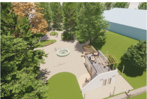
ასეთი იქნება რეაბილიტირებული ხარაგაულის ცენტრალური პარკი. (ფოტოზე პარკის ტერიტორიის ნაწილია წარმოდგენილი).

ტენდერი ასევე დასრულებულია სოფელ მირონმინდაში წმინდა ნიკოლოზის ტაძართან მისასვლელი გზის რეაბილიტაციის პროექტზე, რომელზეც 250 ათასი ლარია გათვალისწინებული.