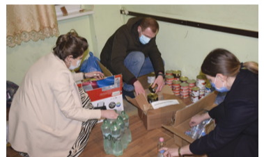
ბი, რომლებიც ხარაგაულის სახელით უკრაინაში გაიგზავნა.