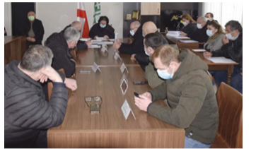
ნარიმარტა და დეპუტატებს მათთვის საინტერესო საკითხებზე ამომწურავი პასუხები გაეცა...