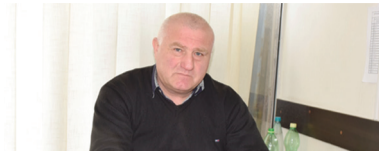
ლურსმანაშვილის, გადამწყვეტილებით, ვაკანსიები მერიის მიერ დაფინანსებული...