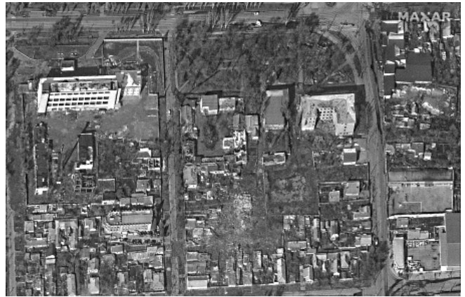
ნანგრევებზე ქვეული მარიუპოლი, რომლის ალბასაც რუსები გააფრთხილეს ცდილობენ ფოტო სატელიტიდან

აღსანიშნავია ის ფაქტიც, რომ საქართველოს უკრაინელი ხალხის დასახმარებლად, თავისი მწირი ბიუჯეტიდან გამომდინარე, წვლილი შეაქვს. მთელი საქართველო ფეხზე დგას. უკრაინის ტერიტორიული მთლიანობისთვის ომში დაიღუპა ოთხი ქართველი მებრძოლი, რომელთაგან 3 უკვე ჩამოსვენენ სამშობლოში და მხედრული პატივით დაკრძალეს. მრავალი ქართველი იბრძვის მოხალისედ ამ ომში, რადგან ვთვლით, რომ ომი უკრაინისთვის არის ომი საქართველოსთვის! თითქოს დაგვაგინყდა ჩვენი პრობლემები და მათ დასახმარებლად ქუდზე კაცია მზად. ქართველს არასდროს ესწავლებოდა გაჭირვებულის თანადგომა და ლუკმის გაყოფა, დღესაც ასეა... მარტო ერთ ნათქვამი კი არა, გულიდან ამოსულია ჩვენი ხმა: სოლიდარობა უკრაინელ ხალხს!..