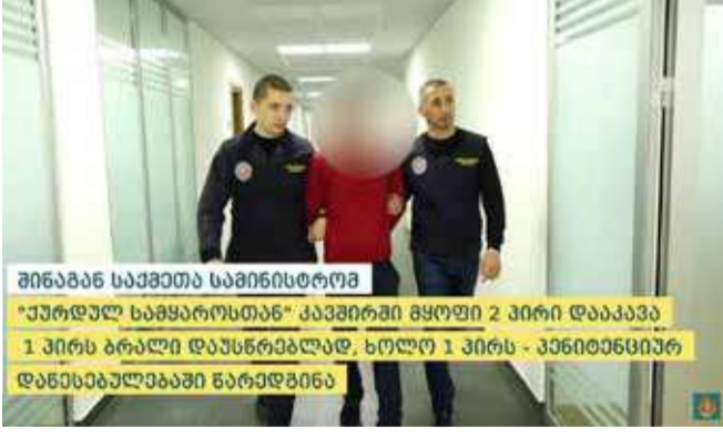
შინაგან საქმეთა სამინისტრომ „ქურდულ სამყაროსთან“ კავშირში მყოფი 2 პირი დააკავა. 1 პირს ბრალი დაუსწრებლად, ხოლო 1 პირს - კანონდანიშნულ დაწესებულებაში ნარკოტიკების

1965 წელს დაბადებული კ.თ. კი „ქურდული სამყაროს წევრისთვის“ ან „კანონიერი ქურდისთვის“ მიმართვის ბრალდებით დააკავეს.