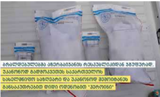
ბრალდებულმა აზერბაიჯანის რესპუბლიკიდან ვაჭურადა, უკანონოდ გადმოკვეთა საქართველოს სახელმწიფო საზღვარი და უკანონოდ შემოიტანა განსაკუთრებით დიდი ოდენობით „ჰეროინი“

დანაშაულები 15-დან 20 წლამდე ან უვადო თავისუფლების აღკვეთას ითვალისწინებს.