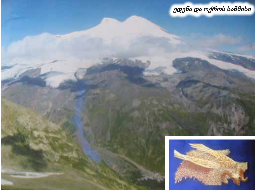
ედენა და ოქროს სანძისი

ლებიხევი ჩრდილოეთით 25 კილომეტრზე გრძელდება. მისი ტერიტორია 350 კვ/კმ-ია. კავკასიონი, თავისი განშტოებებით მთელ ამ მიდამოს ისე უფლის გარშემო, რომ მას განცალკევებული მიკროქვეყნის იერს აძლევს. ქვეყნის გულში ჩამოედინება მდინარე, რომელიც, ესქილესა და ჰეროდოტეს თქმით, ევროპას აზიისგან