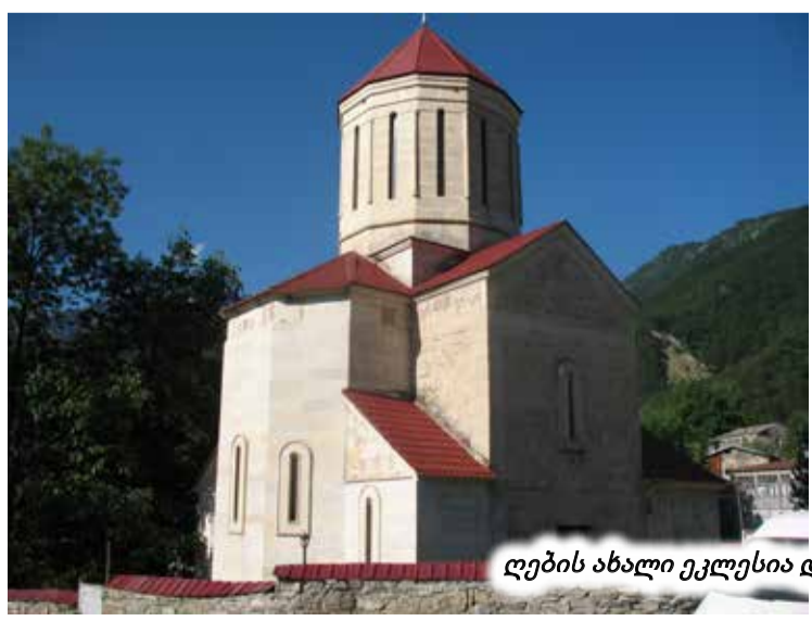
ლების ახალი ეკლესია და „დედალეთისას“ მურყვამი

ახლა მთის რაჭის, უწინარესად კი ლებელების მეორე სათავეანო მწვერვალზეც ვისაუბროთ, რომელსაც ედენა ჰქვია. აბა, ამ ტოპონიმის ქართული შინაარსით ახსნა ვცადოთ. ედენა, ვითომ ზედენაა და მას რაჭული დიალექტისთვის დამახასიათებელი თავთანხმოვანი ჩამოცილებული აქვს? არა მგონია. მაშინ მართო ამ მწვერვალს რატომ აქვს ლების ზედანი (თავს ზევით) მთის სახელი. განა ფასისი, ნითელას, ნიხვარგას და ზოფხიტოს მწვერვლებიც ამავე სიმაღლისანი არ არიან?!... მაგრამ ... მაგრამ საქმე ისაა, რომ „ედენა“ ედემის შუმერული ფორმაა და იგი დაახლოებით 5000 წლის წინანდელი ღმერთკაცის გილგამეშის ეპოსშია ნახსენები, იმ გილგამეშისა, რომელიც შუმერული ქალაქ – სამეფოს, ურუქის მმართველი იყო (გაციხსნით ფასის მყინვარიდან გამომდინარე ერთ-ერთი