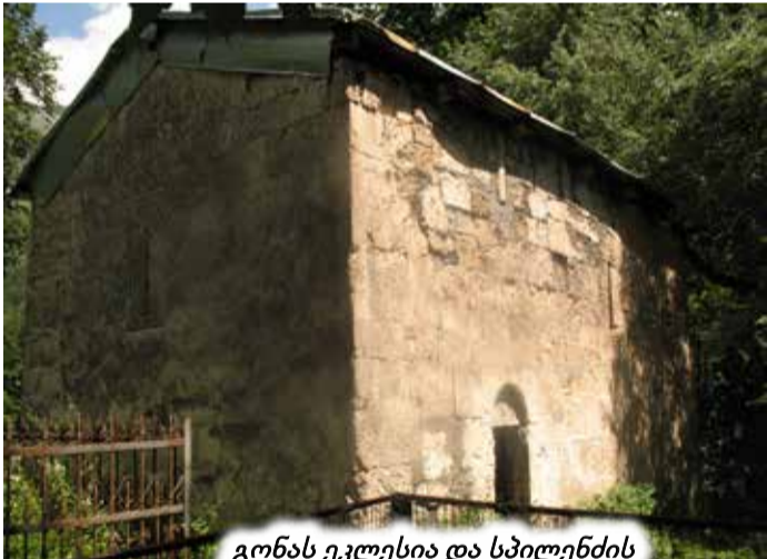
გონას ეკლესია და სპილენძის მადარაოში ჩასასვლელი

... სადაც სპილენძია, იქ ოქროც იქნება, სადაც