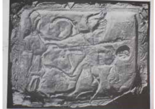
ლების საკურთხევლის წინა ჯვრის ერთ-ერთი ფირფიტა

მდინარე ჩვეუროს ბოლომდე თუ ავყვებით, ლებევეციის უღელტეხილი ჩრდილოეთ კავკასიაში გადავიყვანს. ამ უღელტეხილს ადგილობრივები კირტოშოს უღელტეხილს