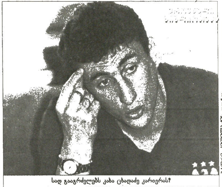
სად გააგრძელებს კახა ცხადაძე კარიერას?