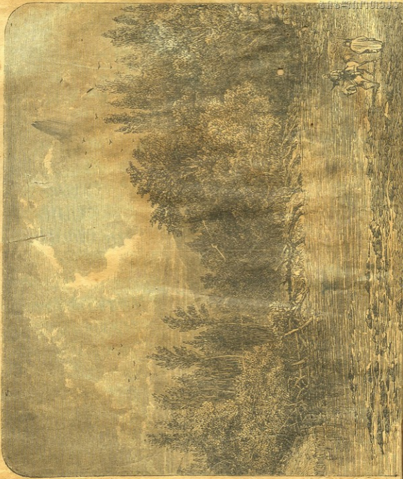
რამკარგი აგო ეს მდინარის ნაწილები მკვლავისთვის.