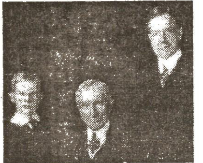
ჯონ დევიდსონ როკფელერი III, ჯონ დევიდსონ როკფელერი-უფროსი და ჯონ დევიდსონ როკფელერი-უმცროსი

გვარიანი ფასდამატებით ყიდდა ინდიელებზე. გარდა ამისა, ეს ბებერი თაღლითი სოფლებში საკუთარ თავს „დოქტორ როკს“ უწოდებდა და თავის „ახანაულ-მოქმედ“ ელექსირს ასაღებდა. როგორც ვესტერნებში გვინა-